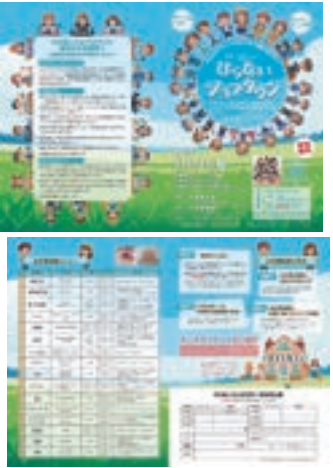
平内町小学生職業体験事業企画運営業務